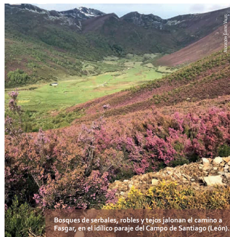
Bosques de serbales, robles y tejos jalonan el camino a Fasgar, en el idílico paraje del Campo de Santiago (León).