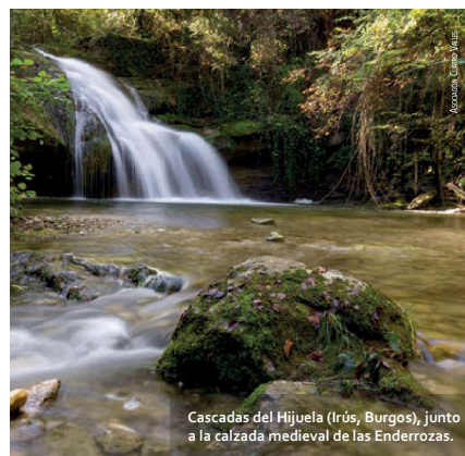
Cascadas del Hijueta (Irús, Burgos), junto a la calzada medieval de las Enderrozcas.