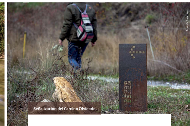
Señalización del Camino Olvidado.

Texto: Rosa Ruiz